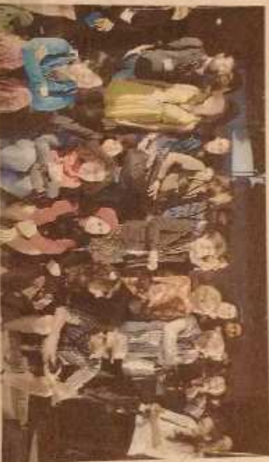
ARRIVERCI Foto di gruppo sul palco per i protagonisti dell'edizione del ventennale

CON una meravigliosa performance della fisarmonica del Maestro Sergio Capoferri, brindisi e tanto di torta si è chiusa la ventesima edizione del Premio Libero Bizzarri che ha visto, in particolare nell'ultima serata, il sold out alla Palazzina Azzurra. Una edizione speciale per festeggiare proprio i 70 anni della rassegna dedicata al documentario che, altri non poteva vedere per prima sul palco, che Cecilia Mangini, una sorta di icona della materia. Ottantaseienne, ma piena di spirito e di vigore professionale ricorda la vita del documentario che è nato, è diventato grande, si è ammalato, è morto e poi rinato grazie alle rassegne dedicate al suo amico Libero, al libero di nome e di fatto — ha precisato — come era ogni membro di quel gruppo di documentaristi di allora che seppur diversi per stile e per metodologie erano profondamente accomunati e legati da un unico obiettivo, quello di dar voce alla realtà e ai fatti contingenti. A Cecilia è stato consegnato il Premio Bizzarri "Una vita per il documentario".