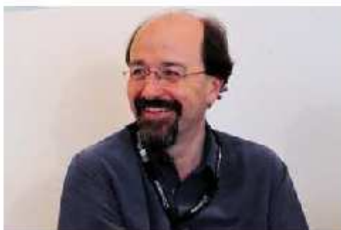
Il giornalista inglese Bill Emmott

L'ex direttore di The Economist Bill Emmott presenta un suo documentario al Premio Libero Bizzarri. In conferenza stampa parla dell'Italia, di Berlusconi, Grillo e i grillini, PD, Massimo D'Alema, Matteo Renzi. E dei giovani che lasciano il Paese. Tra le altre iniziative, «CinemadaMare»